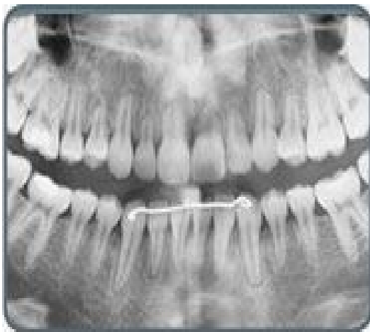
پس از درمان