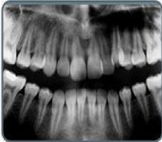
شکل 2- تحلیل اپیکالی دایمی ریشه ناشی از درمان ارتودنسی قبل از درمان

تحلیل ریشه طی درمان ارتودنسی می‌تواند به صورت یاتروژنیک حادث شود. تحلیل ریشه به دو گروه قابل تقسیم است. در تحلیل ایدیوپاتیک لاکونا‌های تحلیلی در تمام سطح ریشه به ویژه یک سوم اپیکالی و میانی با عمق 1 میلی‌متر مشاهده می‌شود (شکل 1). به دنبال قطع اعمال نیرو عمده این لاکوناها با سمان ترمیمی پر می‌شود. در تحلیل اپیکالی که موضوع مورد بحث در اکثر مقالات است حذف قسمتی از سمان و عاج انتهایی اپکس ناشی از اعمال نیروی ارتودنسی اتفاق می‌افتد. بازسازی بخش از دست رفته ریشه تقریباً غیرممکن است و بهترین راه ممانعت از آن کنترل فاکتورهای بیومکانیکال دخیل در ایجاد تحلیل ریشه می‌باشد (1) (شکل 2).