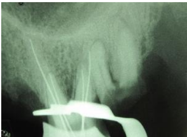
شکل 2- رادیوگرافی طول کارکرد، چهار کانال جداگانه را نشان داد.

مدخل بسیار کوچک دیستوباکال به وسیله اکسپلورر اندودنتیک یافت گردید. در محدوده پالاتال کف اتاقک پالپ، اوریفیسی مشاهده شد که نسبت به موارد معمول، موقعیت آن بسیار دیستوپالاتال بود. با توجه به رادیوگرافی اولیه، با احتمال وجود کانال چهارم، حفره دسترسی به سمت مزیوپالاتال گسترش داده شد و کانال چهارم یافت گردید. مدخل‌های پالاتال به نسبت مدخل‌های باکال در وضعیت کاملاً قرینه ای قرار داشتند. رادیوگرافی اندازه‌گیری تصویر چهار ریشه جداگانه را نشان می‌داد (شکل 2).