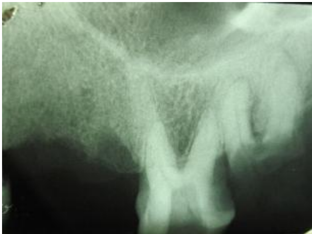
شکل 1- رادیوگرافی پیش از درمان، رادیولونسیس پری اپیکال را نشان نداد.

کامل برخوردار بود. در ارزیابی اولیه رادیوگرافیک، تصویر دندان مورد نظر با آناتومی موارد متعارف همخوانی نداشت (شکل 1).