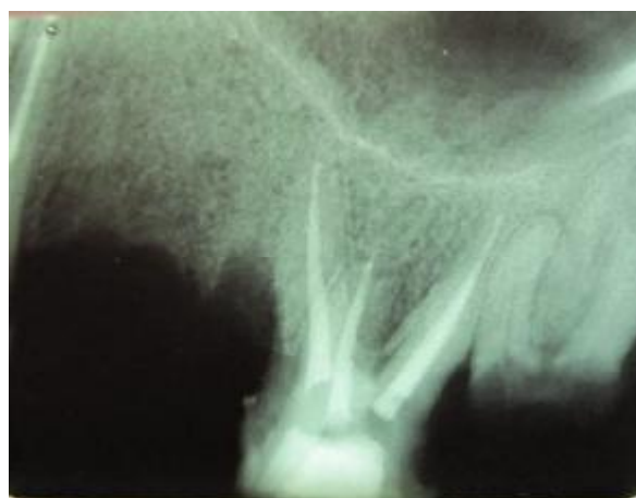
شکل 3- الف) دو ریشه جداگانه پالاتال و کانالها