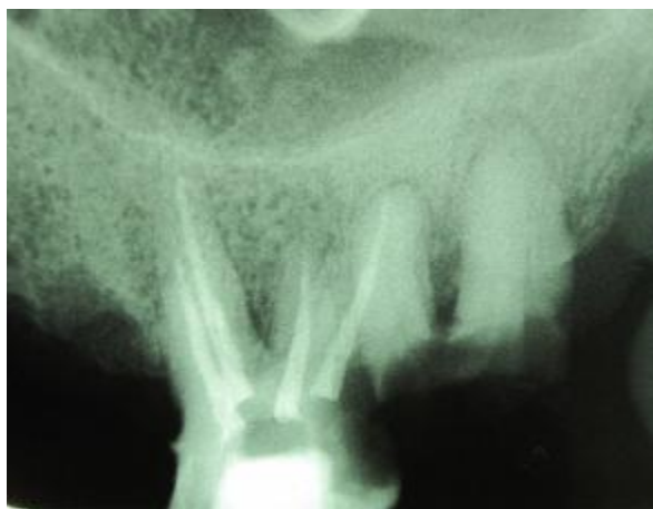
شکل 3- ب) اشعه مرکزی از سمت مزایال تابانده شد.