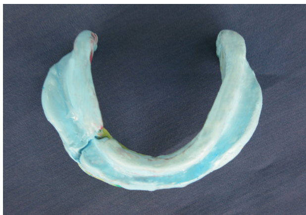
شکل ۴- اتصال دو قسمت قالب

گردید (شکل ۴) و کست به وسیله گچ دندانپزشکی ریخته شد. از آنجایی که بیس به دست آمده حجم کوچک‌تری از تری داشت، با مانور خاصی امکان داخل بردن بیس در دهان به صورت یک تکه حاصل شد و در نهایت مراحل ساخت دنچر به صورت معمول انجام گردید. از آرایش مونوپلن جهت چین دندان‌ها استفاده شد، دنچر تحویل داده شد و جلسات پیگیری حمایت و تنظیم صورت گرفت و پس از ۲ سال پیگیری بیمار از دنچر انجام گردید.