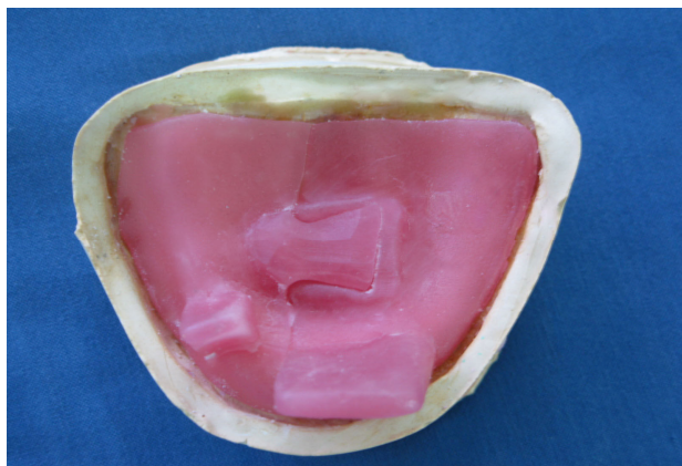
شکل ۳- تری VLC

۸- از آنجایی که در مرحله قبل ثبات قالب ایده‌آل نبود؛ بنابراین جهت دقت بیشتر یک تری VLC دیگر به نحوی طراحی و ساخته شد که قطعات راست و چپ به وسیله یک ناحیه قفل شونده به هم متصل شوند و قسمت کوچک‌تر در سمت چپ که دارای وستیبول عمیق‌تری بود طراحی شد (شکل ۳).