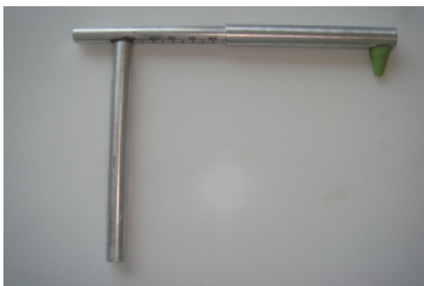
شکل ۲- خط کش مورد استفاده در مطالعه

فکی اورجت است. Zupancic و همکاران با بهره‌گیری از میزان اورجت بیمار تلاش نمودند که روابط فکی زیرین را پیش بینی نمایند، که همبستگی خوبی میان میزان اورجت و رابطه فکی در بیماران کلاس یک، کلاس دو Division 1 و کلاس سه مشاهده شد (۸). با این وجود اورجت قادر به تشخیص روابط اسکلتال کلاس دو Division 2 نبود، که یکی از محدودیتهای این روش به شمار می‌رود. Farkas و همکاران نیز که از پیشگامان آنترپومتری بودند، ارتباط میان اندازه‌گیری‌های آنترپومتریک و سفالومتریک را عمدتاً در بعد عمودی بررسی نموده‌اند (۹،۱۰) و در میان کارهای منتشر شده وی هیچ منبعی که روابط قدامی خلفی را بررسی نموده باشد یافت نشده است. آنچه که در مطالعات وی در بعد عمودی قابل مشاهده می‌باشد، بهره‌گیری و مقایسه از اندازه‌گیری‌های خطی سفالومتریک و آنترپومتریک است. یکی از آنالیزهای سفالومتری که از اندازه‌گیری‌های خطی در بعد قدامی خلفی بهره می‌برد، آنالیز مک نامارا می‌باشد (۱۱). در این آنالیز طول ماگزایلا و مندیبل از محل کندیل سنجیده می‌شود که با توجه به فاصله نسبتاً ثابت مجرای خارجی گوش تا کندیل، شاید بتوان از این لندمارک آنترپومتریک برای اندازه‌گیری‌های خطی مشابه بر روی بافت نرم بهره جست. در صورت برقراری همبستگی مطلوب بین اندازه‌گیری‌های قدامی خلفی آنترپومتریک و سفالومتریک می‌توان به پیش بینی روابط اسکلتال از روی بافت نرم امیدوار بود. هدف از این مطالعه نیز مقایسه اندازه‌گیری‌های به دست آمده از اختلاف واحد آنالیز مک نامارا (Unit Difference in McNamara Analysis) با معادل‌های پیشنهادی روی بافت نرم می‌باشد.