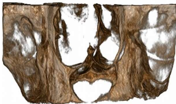
شکل ۲- نمای قلبی شکل در تصویر سه بعدی بازسازی شده

معاینات داخل دهانی، ظاهر نرمال مخاط لبیال مگزیلا را نشان داد و استیوپل محو شده بود اما قوام آن سفت نبود. تورم، موج بود و به صورت تقریبی، با ابعاد ۲۵ میلی متر عرض و ۱۵ میلی متر طول در خط وسط و استیوپل لبیال مگزیلا قرار داشت. در ارزیابی اگزالی، کرونالی و مقطعی مقطع نگاری رایانه‌ای (CBCT)، یک ضایعه موضعی در ناحیه قدامی مگزیلای کاملاً بی‌دندان با ابعاد قدامی خلفی ۱۴/۵ میلی متر، عمودی ۱۵ میلی متر و مدیولترالی ۱۸ میلی متر مشاهده شد. ضایعه حدود کورتیکه مشخص و ساختار داخلی کاملاً رادیولوسنت داشت. در تصویر سه بعدی بازسازی شده، سوپرایمپوزیشن خار قدامی بینی بر روی کیست، شکل قلب را ایجاد کرد (شکل ۲). اکسپنشن قسمت قدامی ریج آلوتولار مگزیلا در نتیجه رشد ضایعه قابل مشاهده بود. صفحه کورتیکالی باکال در بسیاری از مقاطع دیده نشد و صفحه کورتیکالی لینگوال نازک شده بود و در برخی مقاطع دیده نشد. کف حفره بینی نازک شده بود و به موقعیت بالاتری جابه جا شده بود. تورم بافت نرم ناحیه قدامی مگزیلا مشاهده شد.