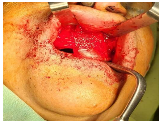
شکل ۳- غشاء و گرفت قرار داده شده‌اند. به بخش آویزان غشاء توجه کنید که در مرحله بعدی به کمک میکروواسکروها به دیواره استخوانی سالم اطراف فیکس می‌شود.

جلسه فالو آپ یک هفته پس از جراحی، بهبود موفقیت آمیزی را نشان داد. بخیه‌ها کشیده شدند و هیچ دهی سنسی دیده نشد. دو ماه بعد از جراحی، قوام سخت و استخوانی با لمس احساس شد. بیمار برای ساخت دنچر کامل به متخصص پروتز ارجاع داده شد.