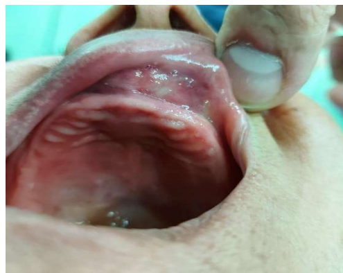
شکل ۱- نمای بالینی، یک تورم با ظاهر نرمال مخاط را در مخاط لبیال مگزایلا نشان می‌دهد که وستیبول را محو کرده است.

خانمی ۶۰ ساله با بی‌دندانی کامل، با شکایت اصلی تورم در ناحیه قدام مگزایلا (شکل ۱) که با نشست دنجر تداخل داشت و برای حدود ۲ یا ۳ سال درد داشت، به دانشکده دندانپزشکی ارجاع داده شد. یک سال پیش، (با تشخیص نادرست اپولیس) درمان لیزر ابلیشن با لیزر ۹۴۰ نانومتر به صورت درمان یک جلسه ای پرتوان با توان تابشی ۳ وات برای ایشان انجام شده بوده است اما تورم مجدداً پس از حدود ۱۰ ماه پدیدار شده بود.