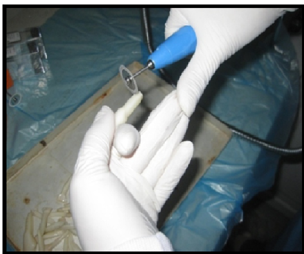
شکل ۱- تهیه سیلندرهای عاجی از یک سوم میانی ریشه دندان‌های انسیزور گاو

agar کشت و در شرایط هوازی در انکوباتور و حرارت ۳۷ درجه سانتی‌گراد به مدت ۲۴ ساعت انکوبه شد. پس از حصول اطمینان از خالص بودن نمونه‌ها، کلونی باکتری‌ها در Brain Heart Infusion broth به طور جداگانه حل شده و سوسپانسیونی با کدورت ۱ مک فارلند تهیه شد.