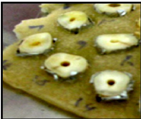
شکل ۲- سیلندرهای عاجی مانده در آکريل

تلقیح سوسپانسیون میکروبی به داخل نمونه‌ها: