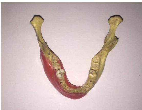
شکل ۱- تصویر مندیبل و دو لایه موم برای بازسازی تنه مندیبل

معیارهای ورود در این مطالعه شامل دندان تک ریشه انسانی کشیده شده سالم با پرکردگی گوتا پرکا در دسترس و بدون شکستگی ریشه بودند. انتخاب نمونه‌ها، بدون توجه به سن، جنس و دلیل Extraction صورت گرفت. تمامی نمونه‌ها برای تهیه تصاویر CBCT و رادیوگرافی PA دیجیتال توسط فردی که جز مشاهده‌گران نبود از شماره ۱ تا ۶۰ به صورت تصادفی کدگذاری شد و هیچ یک از مشاهده‌گران از ترتیب کدگذاری اطلاعی نداشتند. سپس در ریشه نیمی از نمونه‌ها شامل ۳۰ دندان، به صورت تصادفی با استفاده از چیزل و چکش شکستگی باکولینگوالی ایجاد شد که در ادامه با چسب دو قطعه شکسته شده بهم متصل گردید. برای تهیه تصاویر، هر دندان در محل خود بر روی جایگاه خود در مندیبل انسانی قرار گرفت. مزیت استفاده از مندیبل انسانی برای تهیه تصاویر این است که به دلیل سوپرایمپوز شدن استخوان بر روی ریشه دندان تصاویر به دست آمده طبیعی‌تر و مشابه مدل انسانی است. برای بازسازی بافت نرم روی تنه مندیبل از ۲ لایه موم استفاده گردید (شکل ۱).