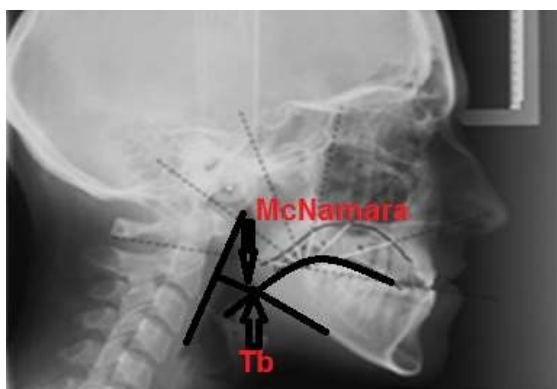
شکل ۲- آنالیز راه هوایی مک نامارا

جهت حصول اطمینان از تغییرات اسکلتال تمامی نمونه‌های شرکت کننده در مطالعه، تغییرات اسکلتی بیماران در طی درمان با دستگاه فانکشنال Twin-block به کمک پارامترس Wit's و زاویه ANB بررسی شد. جهت تجزیه و تحلیل آماری داده‌ها در این مطالعه نرم‌افزار IBM SPSS Version 21.0 مورد استفاده قرار گرفت.