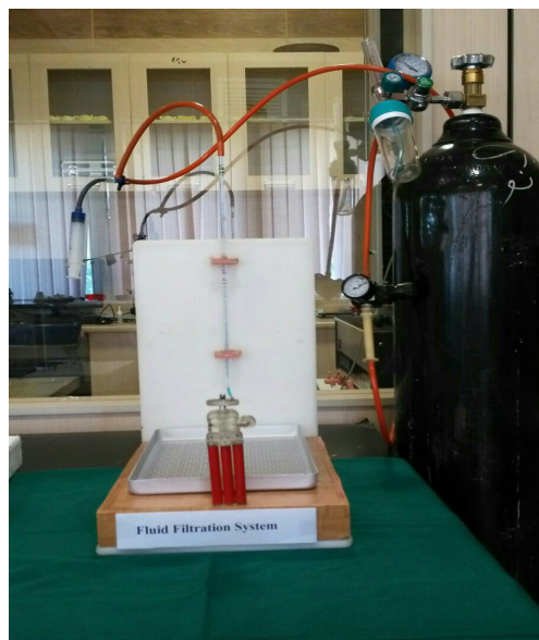
شکل ۱- دستگاه اندازه‌گیری فیلتراسیون مایع

مطالعه دیگری که توسط Borges و همکاران (۲۰) (۲۰۱۰) بر روی خصوصیات فیزیکی و شیمیایی Bio MTA و ProRoot MTA و سمان پورتلند انجام شد نشان داد که تفاوت چشمگیری بین نسبت آب به پودر در دو ماده Bio MTA و ProRoot MTA وجود ندارد و