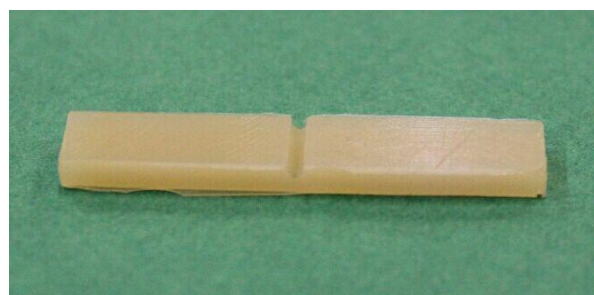
شکل ۱- الف: شکل نمونه