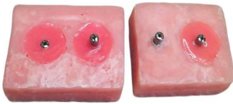
شکل ۲- بلوک‌های آکرلیکی تهیه شدند به طوری که ایمپلنت‌ها در عمق‌های مختلف آن قرار گرفته‌اند.

نحوه سوار کردن دو قطعه ترانسفر قالب گیری و ایمپلنت به روی هم، قبل از شروع کار به دانشجویان آموزش داده شد. سپس از تمامی دانشجویان انتخاب شده خواسته شد تا ترانسفرهای قالب‌گیری یا همان ایمپرن کویپینگ‌ها (Hex.close, ارتفاع ۱۵ قطر ۴/۵ میلی‌متر) (Implantium®, Ltd., Seoul Korea) را بر روی چهار ایمپلنت مدل آماده شده ببندند. به دانشجویان ۳ بار فرصت داده شد تا اتصال ترانسفر قالب‌گیری بر روی ایمپلنت خود را اصلاح نمایند. لازم به ذکر است در صورتی که پس از ۵ بار استفاده از مدل، آنالوگ لته‌ای پاره شده یا آسیب می‌دید، تعویض شده و با یک آنالوگ لته‌ای سالم جایگزین می‌گردید. برای ارزیابی صحت اتصال ترانسفر، از یک مدل نشان‌دار که به صورت ایده‌آل بر روی ایمپلنت بسته شده به عنوان الگو استفاده شد بدین شکل که پس از قرار دادن ترانسفر قالب‌گیری بر روی ایمپلنت به شکل صحیح، بر روی ترانسفر قالب‌گیری به موازات لبه ایمپلنت خطی رسم شد و توسط دیسک خراشیده شد به شکلی که پاک نگردد. سپس چهار ترانسفر قالب‌گیری نشان‌دار شده بر روی ایمپلنت‌ها توسط پنجاه نفر از دانشجویان سال آخر رشته دندان پزشکی بسته شد. در نهایت، بعد از حذف لته شبیه‌سازی شده، با توجه به خطوط رسم شده روی ترانسفرهای قالب‌گیری میزان صحت اتصال (با توجه به عمق) به وسیله یک ذره بین با بزرگنمایی ۴x توسط یک متخصص پروتز مجرب سنجیده شد. اطلاعات به دست آمده از پنجاه دانشجو در یک جدول به صورت نشست صحیح یا ناصحیح برای هر چهار ایمپلنت ثبت شد. داده‌های جمع‌آوری شده توسط تست آماری Cochran's Q مورد آنالیز آماری قرار گرفتند. خطای نوع اول آماری برابر ۰/۰۵ در نظر گرفته شد، همچنین عملیات آماری با استفاده از نرم‌افزار SPSS 22 (Spss Inc., Chicago, IL, USA) انجام شد.