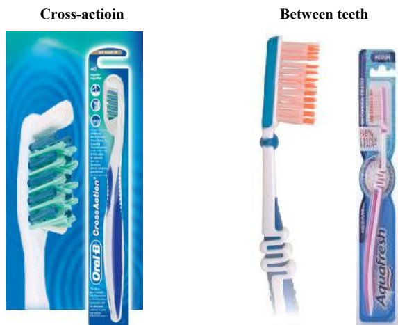
شکل ۱- مسواک‌های مورد مطالعه

ارایه مسواک (Aquafresh Co, England) Between teeth با هدف کارایی بالاتر در برداشت پلاک بخصوص از نواحی بین دندانی محور اصلی انجام این مطالعه است. طول سر مسواک ۲۹ میلی‌متر و عرض سر مسواک ۱۲ میلی‌متر است. این مسواک دارای ۴ ردیف و در هر ردیف ۱۲ دسته تافت و در هر تافت ۶ بریستل با طول بیشتری نسبت به سایر بریستل‌ها قرار گرفته و شرکت تولید کننده مدعی است وجود همین بریستل‌های طویل باعث برداشت بیشتر پلاک به خصوص از نواحی بین دندانی شده و نیاز به استفاده از نخ دندان را از بین می‌برد. از آن جا که کاربرد نخ دندان در بیماران با مشکلاتی همراه است و نیاز به داشتن مهارت کافی دارد، از طرفی در مطالعات گذشته برتری مسواک Cross action (Oral-B Co, England)، طول سر مسواک ۲۷ میلی‌متر و عرض آن ۱۲ میلی‌متر دارای Unituft در سر مسواک و دارای ۳ ردیف و در هر ردیف ۸ دسته تافت به طوری که یک در میان یک دسته تافت از تافت مجاور بلندتر است و دسته‌های تافت ردیف وسط مایل قرار گرفته‌اند (شکل ۱).