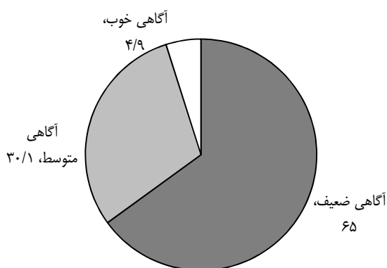
نمودار ۱- توزیع ۳۸۵ نفر بر حسب میزان آگاهی از مفهوم کلمه جراح- دندانپزشک، تهران، سال ۹۰-۱۳۸۹

میزان ۶۷/۸٪ بود، که جراح-دندانپزشک را همان متخصص جراحی فک و صورت قلمداد می‌کردند.