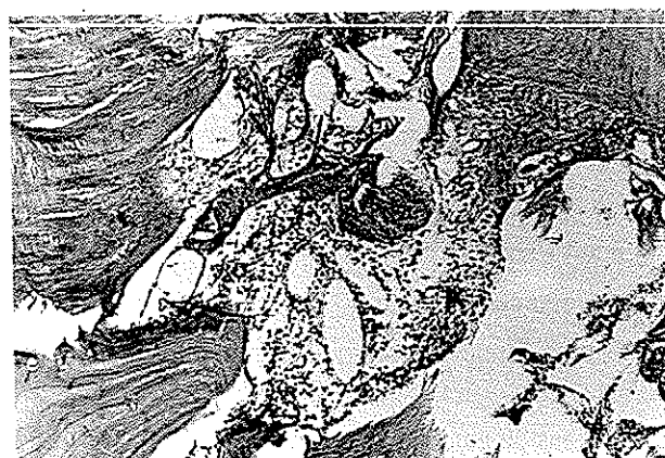
تصویر شماره ۵- نمونه آزمایشی در فاصله زمانی ۲۴ ساعت با آماس