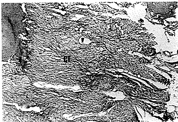
تصویر شماره ۱- نمونه آزمایشی در فاصله زمانی ۶ ساعت بدون