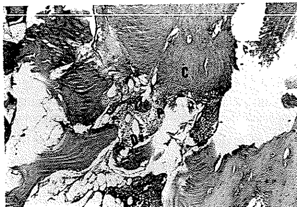
تصویر شماره ۵- نمونه آزمایشی در فاصله زمانی ۲۴ ساعت با آماس شدید- بزرگنمایی ۴۰×۱۰؛ رنگ آمیزی H&E C- سمان P- پلی مورفونوکلئو D.V- رگ دیلاته