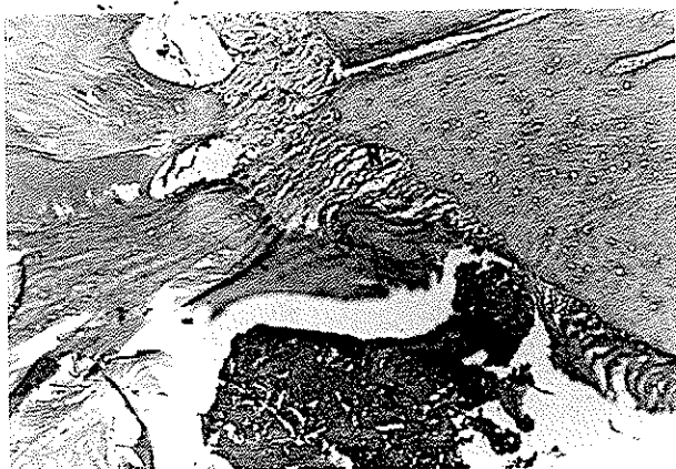
تصویر شماره ۳- نمونه آزمایشی در فاصله زمانی ۱۲ ساعت با آماس