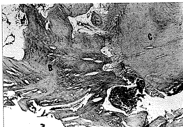
تصویر شماره ۳- نمونه آزمایشی در فاصله زمانی ۱۲ ساعت با آماس خفیف- بزرگنمایی ۴۰×۱۰؛ رنگ آمیزی H&E C- سمان B- تراپیکول استخوانی R- تحلیل سمان S- سکستر