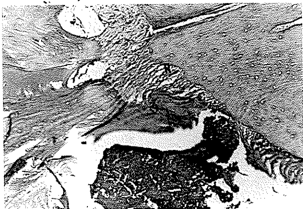
تصویر شماره ۴- بزرگنمایی ۱۰×۱۰ از تصویر شماره ۳