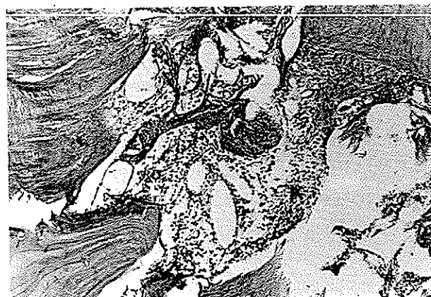
تصویر شماره ۶- بزرگنمایی ۱۰×۱۰ از تصویر شماره ۵