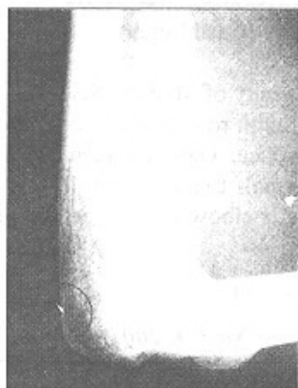
تصویر شماره ۱- تصویر رادیوگرافی آرنج که بخشی از فرزند را نشان می‌دهد.

حدود چهار ماه این توده وجود داشته است؛ تغییر حجمی نداده بود و دارای قوامی نرم و متحرک بود. جهت تشخیص و درمان به یک ارتوید (متخصص دست) مراجعه نمود که در تیرماه (همان سال) رادیوگرافی از ناحیه مورد نظر گرفته شد (تصویر شماره ۱) و به دلیل عدم تشخیص دقیق، سونوگرافی نیز از محل مورد نظر انجام شد (تصویر شماره ۲).