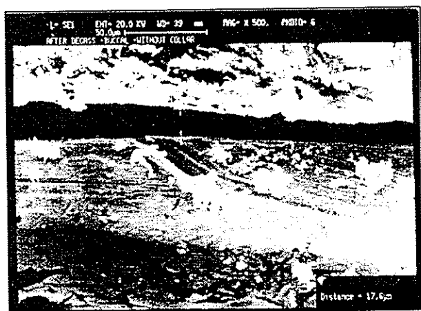
تصویر شماره ۲- تصاویر میکروسکوپ الکترونی سطح باکال نمونه‌های بدون کلار با بزرگنمایی ۵۰۰ برابر در مرحله بعد از دگاز