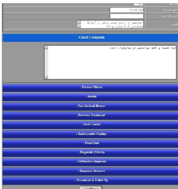
شکل ۳- نوارهای ورود داده ها براساس فرمت پرونده های بخش بیماری های دهان و فک و صورت

Agile ماکروسافت به کار رفت. برای پیاده سازی و ساخت پایگاه داده ها از موتور 2008 SQL server و برای گزارش گیری از موتور SQL reporting services استفاده شد. جهت طراحی ساختار اصلی، زبان برنامه نویسی Vb.net در محیط Visual studio 2010 که در فریم ورک Net4. پیاده سازی شده است، به کار رفت. در ابتدا عناصر اصلی سیستم آنالیز و مشخص شده و سپس نیازها و خصوصیات هر یک تعیین گردید. در مرحله بعد دیاگرام روابط آن ها (ارتباطات) رسم شده و سپس طبق خصوصیات آنالیز شده، جداول هر یک از آن ها طراحی گردید.