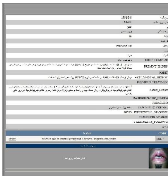
شکل ۶- نمونه‌ای از صفحه گزارش‌گیری