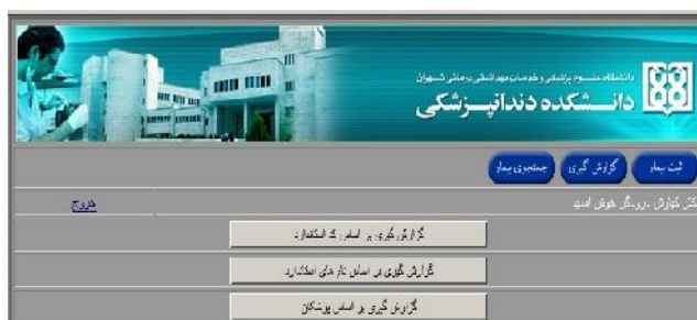
شکل ۵- صفحه گزارش‌گیری