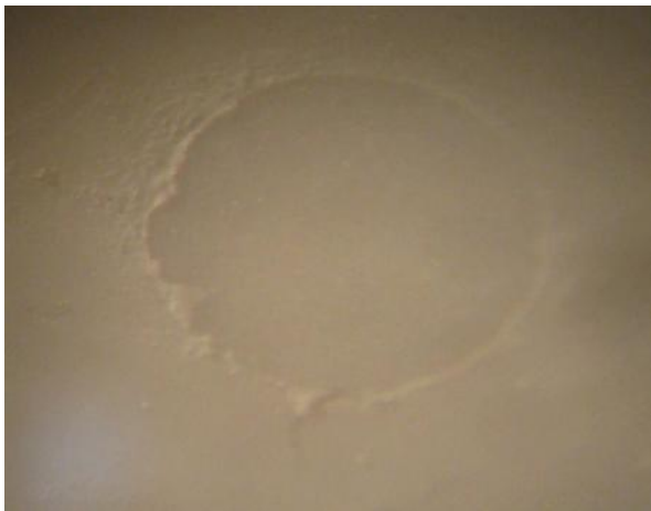
شکل ۵- بررسی نحوه شکست با استفاده از استریومیکروسکوپ

در این حالت اطمینان بیشتری از توزیع بار برشی در ناحیه اینترفاسیال وجود داشت، قبل از آغاز Load نیرو دقت شد که حلقه سیمی تا حد امکان نزدیک به ناحیه اینترفاسیال باشد. سپس نمونه‌ها در معرض نیروی برشی با سرعت 0.5 \text{ mm/min} قرار گرفتند تا شکست اتفاق بیفتد. نیروی اعمال شده بر نمونه برحسب نیوتن از روی مانیتور دستگاه یادداشت شد و از تقسیم این نیرو بر سطح مقطع استوانه کامپوزیتی (برابر با مساحت سطح اتصال) استحکام باند ریزبرشی برحسب مگاپاسکال به دست آمد. باتوجه به مستقل بودن دو متغیر سرامیک زیرکونیایی و نوع سمان مصرفی و وابسته بودن متغیر استحکام باند ریزبرشی از روش Two-way ANOVA برای تحلیل و آنالیز داده‌ها استفاده شد. در مرحله بعد نمونه‌ها برای تعیین نحوه شکست با استفاده از استریومیکروسکوپ تحت بررسی قرار گرفتند (شکل ۵).