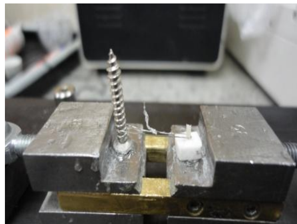
شکل ۴- حلقه در یک سو در دور استوانه کامپوزیتی قرار داده شد به نحوی که تقریباً با نیمی از محیط استوانه در تماس باشد

بین دو حمام آب 50^\circ\text{C} و 55^\circ\text{C} درجه سانتی‌گراد حرکت کردند، فاصله بین دو حمام 15 ثانیه و مدت زمانی که در هر حمام قرار می‌گرفتند 30 ثانیه بود. سپس نمونه‌ها جهت انجام تست ریزبرشی به دستگاه (EZ-Test-500N, Shimadzu, Universal testing machine (Zapiti, Dental Kyoto, Japan) با استفاده از چسب سیانو آکریلات (Ventures of America, Corona, CA, USA) متصل شدند. باند برشی در این مطالعه به روش Wire and Loop اندازه‌گیری شده است. Loop با استفاده از سیم ارتودنسی به قطر 0.2 میلی‌متر تهیه شد. این حلقه در یک سو در دور استوانه کامپوزیتی قرار داده شد به نحوی که تقریباً با نیمی از محیط استوانه در تماس باشد، در طرف مقابل، سیم در دور میله‌هایی قرار داده شده که به همین منظور تعبیه شده بودند. اتصال بین استوانه، سیم و میله‌ها طوری انجام شد که خط اصلی بین این سه جزء تست در یک راستا قرار گیرد (شکل ۴).