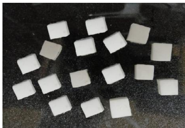
شکل ۱- بلوک‌های پیش‌ساخته سینتر شده از دو نوع کور زیرکونیایی سفید رنگ

بلوک‌های پیش‌ساخته سینتر شده از دو نوع کور زیرکونیای سفید رنگ Cercon و Zir Konzahn (Gais, Bruneck, Italy) به ابعاد 3 \times 7 \times 7 \text{ mm}^3 در رزین پلی‌استر مانت گردید. سپس این بلوک‌ها توسط دستگاه Low speed diamond saw (لبه برنده تیغه از جنس الماس و ضخامت آن 0.5 میلی‌متر بود) برش خوردند (شکل ۱). با انجام برش تعداد ۲۴ نمونه از هر دو نوع کور زیرکونیایی با ابعاد 3 \times 7 \times 7 \text{ mm}^3 تهیه شد. نمونه‌ها توسط ذرات \text{Al}_2\text{O}_3 با قطر 50 \mu\text{m} و فشار ۳ بار در فاصله ۱۰ میلی‌متر به مدت زمان ۱۰ ثانیه سندبلاست شدند، سپس نمونه‌ها به مدت ۲ دقیقه در دستگاه اولتراسونیک حاوی اتانول ۹۶٪ قرار گرفتند تا آلودگی سطحی آن‌ها حذف گردد. نمونه‌ها به ۴ گروه ۱۲ تایی تقسیم شدند، به گونه‌ای که دو گروه ۱۲ تایی Cercon و دو گروه ۱۲ تایی Zir Konzahn داشتیم. لوله‌های پلاستیکی شفاف با قطر داخلی ۱ میلی‌متر و ارتفاع ۳ میلی‌متر که توسط کامپوزیت Flow رنگ A 2 (3M ESPE, Germany) پر شده بود، توسط دستگاه لایت (Bluephase 16i, Ivoclar Vivadent, Austria) با شدت (500 \text{ mW/cm}^2) در دو مرحله ۴۰ ثانیه‌ای از دو سمت مقابل هم کیور شد و استوانه‌های کامپوزیتی با استفاده از تیغ بیستوری از داخل لوله‌های پلاستیکی خارج شدند (شکل ۲).