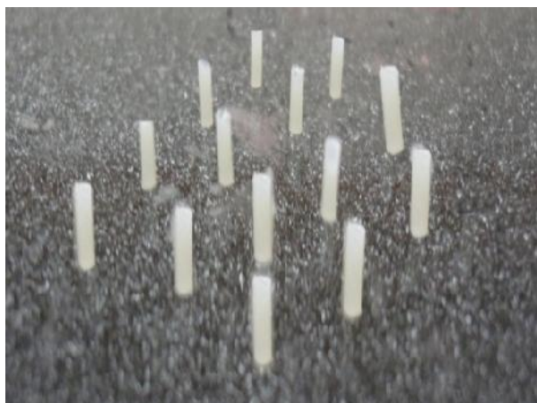
شکل ۲- استوانه‌های کامپوزیتی