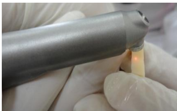
شکل ۱- تابش لیزر

شده و برای برش‌های افقی و عمودی در دستگاه (Isomet, Low speed saw, Buehler, Germany) Low speed isomet به هدف به دست آوردن حداقل ۱۴ نمونه هر کدام به ابعاد ۱×۱×۱ برای انجام تست ریزکشی قرار گرفتند (شکل ۳). سپس در دستگاه سنجش استحکام باند ریزکشی (Bisco, Canada Inc) با سرعت ۰/۵ میلی‌متر در دقیقه تا نقطه شکست قرار گرفتند (شکل ۴).