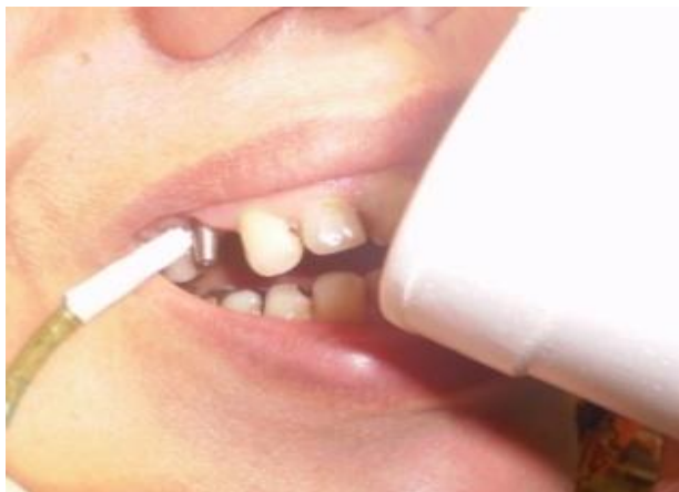
شکل ۴- بیمار در حال آشامیدن مایعات

سرد و گرم به صورت جداگانه تعیین شدند. دمای نهایی (بعد از ثبت ۱۰ مرحله) مایعات سرد و گرم توسط دستگاه ترمومتر ثبت شده و اندازه‌گیری تغییرات دمایی به پایان رسید.