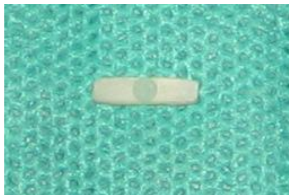
شکل ۲- نمونه‌های بعد از برش به صورت میله‌هایی بودند که کور کامپوزیتی در دو طرف و پست در مرکز قرار دارد.

(Isomet Saw, Buehler LTD, Lake Bluff, USA) استفاده شد. تمامی نمونه‌ها با سرعتی یکسان تحت خنک‌کننده آبی برش داده شدند. جهت قرارگیری نمونه‌ها در دستگاه برش عمود بر تیغه بود تا بتوان برشهایی عرضی از هر نمونه به دست آورد و در نهایت ۴ برش هریک به ضخامت ۱ میلی‌متر از هر نمونه اولیه حاصل شد. بدین ترتیب ابعاد نهایی نمونه‌ها ۱×۲×۹ میلی‌متر بود (اشکال ۲ و ۳).