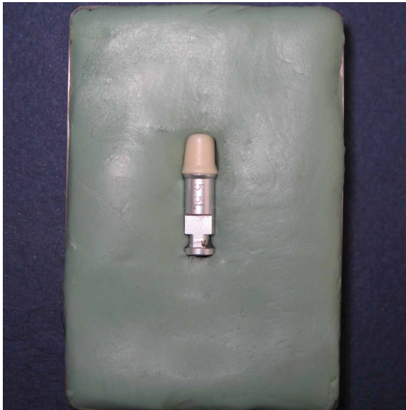
شکل ۳- قرارگیری مجموعه کور و مدل آزمایشی به صورت افقی در ایندکس پوتی

Speedex استفاده شد. یکی از کوره‌های ساخته شده روی مدل آزمایشی قرار گرفته و این مجموعه به صورت افقی از یکی از ۴ وجه