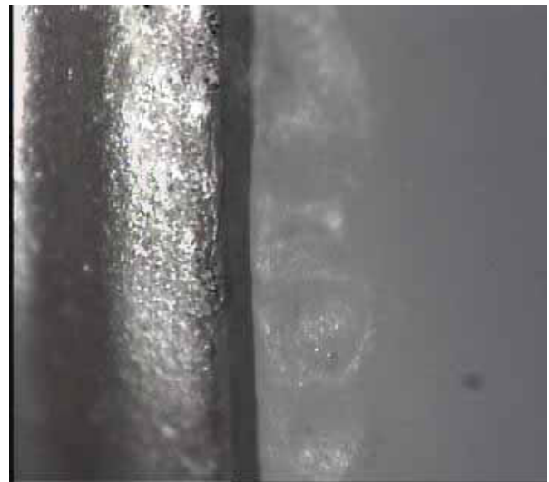
شکل ۴- تصویر تهیه شده از لبه کور و مدل آزمایشی توسط استریومیکروسکوپ