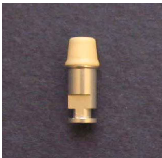
شکل ۱- کور ساخته شده که به طور کامل روی مدل آزمایشی نشسته است.

برای نشاندن کورهای تهیه شده روی مدل آزمایشی، از یک اسپری مخصوص به نام Arti Spray (طبق دستورالعمل کارخانه) استفاده شد. بدین ترتیب که داخل کور یک لایه از این اسپری زده شد و سپس کور روی مدل آزمایشی قرار گرفته و تمام نقاطی که در سطح داخلی کور از ورای اسپری مشخص بودند، به عنوان نقاط ممانعت‌کننده از نشست کامل، توسط هندپیس با سرعت بالا و فرز روند ریزالماسی با خط آبی حذف شدند. این عمل تا نشست کامل کور ادامه یافت (شکل ۱).