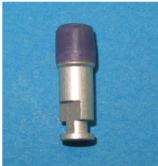
شکل ۲- مدل مومی finish شده روی مدل آزمایشی

درنهایت، مدل مومی روی مدل آزمایشی توسط یک برنیشر finish شد (شکل ۲).