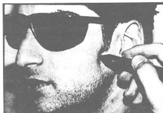
تصویر ۲- نحوه تابش لیزر بر نقاط خارج دهانی