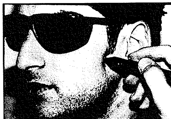
تصویر ۲- نحوه تابش لیزر بر نقاط خارج دهانی