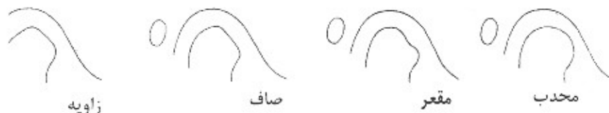
شکل ۳- اشکال مختلف کنديل

پس از اندازه‌گیری خصوصیات کنديلار و منديبولار و