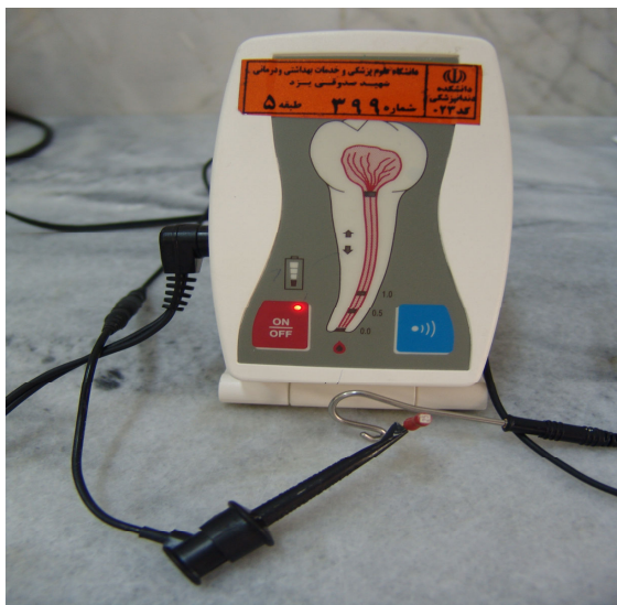
شکل ۱- دستگاه Novapex

بافت پالپ داخل اتاقک پالپ وجود داشت به کمک اسکواوتور (Excavator) و یا فرز روند کارباید توسط انگل با دور کم (Low speed) حذف شد و پس از ایزوله کردن دندان با رابردم و کلمپ، ناحیه پالپ چمبر با نرمال سالین شستشو داده شد و پس از خشک کردن مدخل کانال برای هر دندان یک اندکس ثابت انسیزالی در نظر گرفته شد. Apex locatorهای مورد استفاده در این تحقیق (Novapex (VDW GmbH) (شکل ۱) و Root ZX (Dentaport-us) بود (شکل ۲).