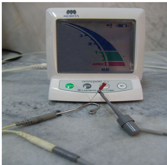
شکل ۲- دستگاه Root ZX

دقت کافی برخوردار نیستند. اما نسل آخر این دستگاه‌ها با امپدانس متغیر در مقایسه با نسل‌های پیشین مزایای فراوانی دارند (۱۳). تحقیقات فراوانی برای ارزیابی دقت این وسایل انجام گرفته است که میزان دقت آنها را تا حدود ۹۰٪ نشان داده است (۵، ۱۴-۱۸). مطالعه Dunlap و همکاران (۱۹۹۸) دقت دستگاه Root ZX را در کانال‌های زنده و غیر زنده مورد بررسی قرار داد و نشان داد که از نظر آماری تفاوت معنی‌داری در این کانال‌ها وجود ندارد و میزان دقت دستگاه ۸۲/۳٪ می‌باشد (۱۹). همچنین مطالعه Plotino و همکاران (۲۰۰۶) میزان موفقیت این دستگاه را ۹۴/۲۸ درصد گزارش کرده است (۲۰) و مطالعه D'Assunção و همکاران (۲۰۰۷) میزان دقت دستگاه Root ZX را ۹۷/۴۴٪ نشان داده است (۲۱). همچنین D'Assunção و همکاران (۲۰۰۶) در یک مطالعه in vitro گزارش نموده‌اند بین دقت دستگاه‌های Root ZX و Novapex اختلاف معنی‌داری وجود ندارد و هر دو این دستگاه‌ها می‌توانند با دقت بالا در تعیین طول کانال به کار روند (۲۲).