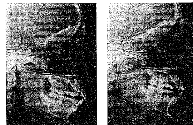
تصویر ۳- تریسینگ سفالومتری بیمار شماره ۱۲۷ در وضعیت استاندارد (سمت راست) و در وضعیت طبیعی سر (سمت چپ)