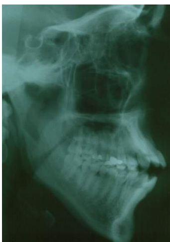
شکل 2 (C) - سفالومتری قبل از درمان

همه بیماران Moderate anchorage داشتند. High Pull Headgear (به علت اثرات اینترودژن روی دندان‌های مولر بالا) به همراه دو قلابی که در ناحیه دندان کانین بر روی کمان داخلی آن لحیم شده بود، جهت بستن Open bite مورد استفاده قرار گرفت. دو قلاب دیگر بر روی دندان‌های کانین فک پایین قرار داده شد. دو الاستیک (1.8, Light, Dentaaurum, Germany)، قلاب‌های بالایی (بر روی کمان داخلی) را به صورت عمودی به دو قلاب پایین (روی دندان‌های کانین) متصل می‌کرد. الاستیک‌ها هنگام بسته بودن دهان 10 گرم و هنگام باز شدن دهان 60 گرم نیرو تولید می‌کردند. مجموعه High Pull Headgear و دو قلاب کمان داخلی، Lower Anterior High Pull (LAHP) نامیده شد (شکل 1). به بیماران گفته شد از این دستگاه به مدت 18 ساعت در روز برای 2 \pm 8 ماه استفاده کنند. سفالومتری، فوتوگرافی و کست‌های مطالعه از بیماران در آغاز (شکل 2) و خاتمه درمان (شکل 3) تهیه شدند. اکستروژن حقیقی (جابجایی اپکس که در شکل 4 به نام A نشان داده شده است)، اکستروژن نسبی (Retroclination) دندان و اکستروژن کل، برای اینسایزورهای بالا و پایین اندازه‌گیری شد. اندازه‌گیری‌ها بدین ترتیب