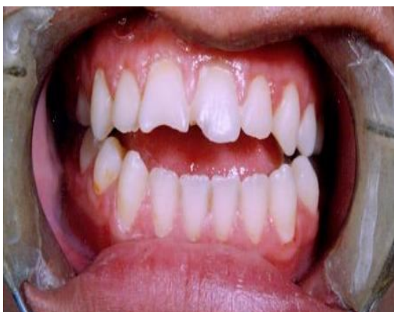
شکل 2 (A) - فوتوگرافی داخل دهانی قبل از درمان

Lingual root torque بر روی دندان‌های قدامی فک بالا، قرار دادن Lingual crown torque در دندان‌های خلفی فک پایین و ایجاد Active labial crown torque در دندان‌های قدامی فک پایین انجام شد.