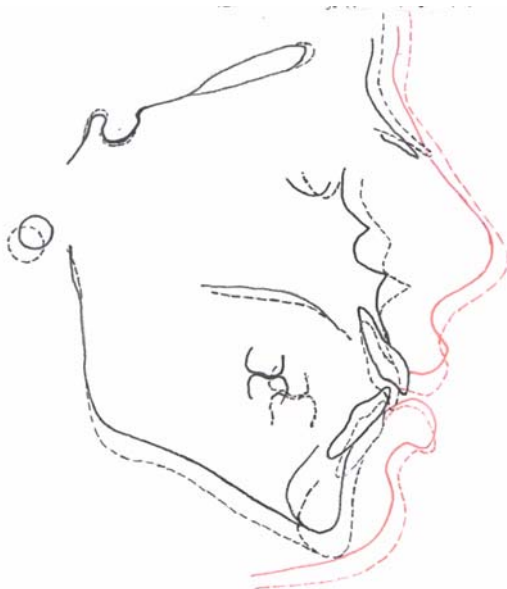
تصویر ۲- سوپرایمپوزیشن رادیوگرافی یکی از بیماران مورد مطالعه

موقعیت شاخصها قبل از درمان با خطوط پیوسته و موقعیت آنها بعد از درمان