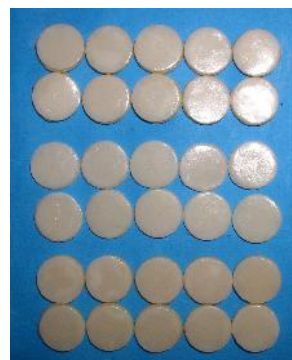
شکل ۴- نمونه‌های آماده شده پس از سیمان کردن لامینیت با پس‌زمینه

انتخاب ضخامت ۱ میلیمتری از سیمان با این فرض بود که در نمونه‌های کلینیکی یعنی دندان، نقطه تغییر رنگ‌یافته بیش از نقاط دیگر تراش داده می‌شود و از این فضا با کمک سیمان و shade modifier برای خنثی کردن رنگ استفاده می‌گردد. تعداد ۳۰ نمونه تهیه شده (شکل ۴) جهت ثبت ابعاد رنگ توسط دستگاه اسپکتروفوتومتر با شرایط ذکر شده قبلی، مورد بررسی قرار گرفتند. (به هر نمونه در این حالت شماره از ۲۱ تا ۳۰ در گروه مربوطه تعلق گرفت). لازم به یادآوری است که سطح همه نمونه‌ها در هر یک از مراحل قبل از خوانده شدن توسط دستگاه، با الکل سفید پاک شد تا آلودگی‌های سطحی نمونه‌ها نتیجه را مخدوش ننماید.