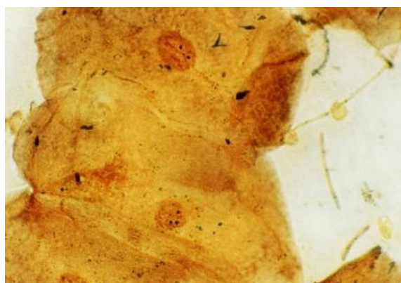
شکل ۲- AgNORs در نمونه سیتولوژی سلول‌های مخاط سالم گونه در مرد غیرسیگاری. نقاط محدود و گرد می‌باشند. (AgNOR stain, \times 1000 )