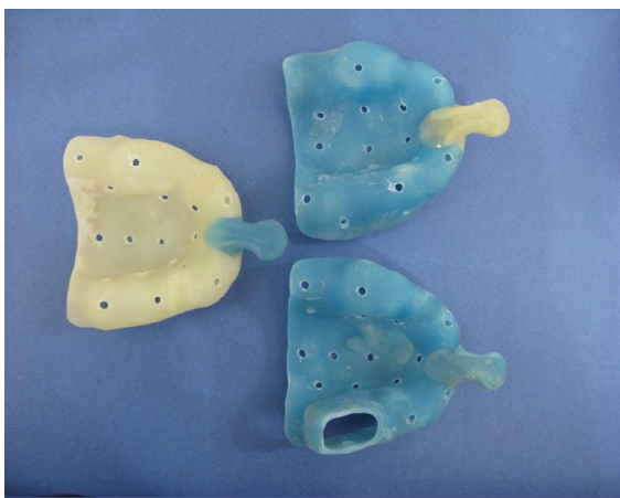
شکل 2- تری‌های اختصاصی به صورت تری باز و تری بسته تهیه شده

بین مطالعاتی که در مورد تکنیک قالب‌گیری بررسی کرده‌اند، Carr (1991) دو تکنیک مستقیم و غیرمستقیم را روی 5 مدل ایمپلنت مورد بررسی قرار داد و نتیجه گرفت که در روش مستقیم (Direct transfer) دقت بسیار بیشتری روی کست نهایی به دست می‌آید (8). در سال 2001 Daoudi و همکاران دقت 4 روش قالب‌گیری را با استفاده از 2 ماده قالب‌گیری متفاوت مطالعه کردند (15). نتایج تفاوت‌های زیادی را در مقایسه تکنیک قالب‌گیری Repositioning با تکنیک Pick up نشان دادند. در سال 2008 Lee و همکاران (16) در یک مطالعه مروری که با هدف بررسی دقت تکنیک‌های مختلف قالب‌گیری و نیز فاکتورهای مؤثر در دقت قالب‌گیری از ایمپلنت انجام شد، نتایجی به شرح ذیل ارائه کردند: از میان حدود 14 مطالعه که دقت قالب‌گیری به روش Pick و Transfer up را بررسی کرده بودند 5 مطالعه 3 یا تعداد کمتری ایمپلنت را مورد استفاده قرار داده بودند؛ 4 مطالعه تفاوتی بین تکنیک Transfer و Pick up پیدا نکردند؛ 9 مطالعه مقایسه این دو تکنیک را وقتی که 4 یا تعداد بیشتری ایمپلنت مورد استفاده قرار گرفته بودند بررسی کردند که 5 تا از آنها دقت بیشتری را در تکنیک Pick up و یکی در تکنیک Transfer نشان دادند و 3 مطالعه تفاوتی بین دو تکنیک نشان ندادند. هدف از انجام این مطالعه، بررسی دقت ابعادی و زاویه‌ای دو تکنیک قالب‌گیری تری باز و تری بسته و دقت ثبت جزئیات سطحی با استفاده از ماده قالب‌گیری پلی‌اتر بود.