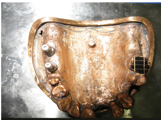
شکل 1- کست مرجع تهیه شده

یک رفرنس فلزی به عنوان مرجع اندازه‌گیری وجود داشت. با هیدروکلوئید غیرقابل برگشت (Alginoplast; Heraeus Kulzer, Hanau, Germany) از مدل درحالی که ترانسفر کوپینگ‌های مربوط به قالب‌گیری تری بسته بر روی آن بسته شده بود قالب تهیه شد. بدین ترتیب کستی ساخته شد که تری اختصاصی از آن به دست آمد. برای ساخت تری اختصاصی جهت قالب‌گیری از دندان به تنهایی، بدون وجود کوپینگ‌ها قالب‌گیری انجام شده و تری اختصاصی ساخته شد. کست‌ها با دو لایه موم بیس پلیت (Modelling Wax; Dentsply, Weybridge, UK) پوشانده شد تا ضخامت کافی ماده قالب‌گیری پلی‌اتر فراهم گردد و به علاوه 3 استاپ بافتی در آن تعبیه شد تا موقعیت قرارگیری تری در هنگام تهیه قالب و نیز ضخامت ماده قالب‌گیری استاندارد باشد. با استفاده از نرم‌افزار Mini tab حجم نمونه 9 عدد در هر گروه برای مطالعه حاضر تعیین گردید.