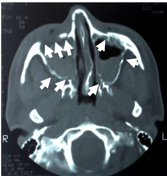
شکل ۳- مقطع اکزیال از CT اسکن بیمار، مناطق شکستگی با فلش مشخص شده است

اطلاعات مربوط به هر بیمار در فرم اطلاعاتی تهیه شده ثبت و یافته‌ها توسط نرم افزار SPSS مورد بررسی قرار گرفت، سپس حساسیت و ویژگی نواحی چپ و راست ناحیه اوربیت، گونه و سینوس ماگزایلا در هم ادغام و به صورت یک عدد کلی بیان شد.