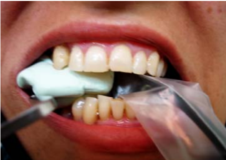
ب- sensor و template با XCP در دهان بیمار