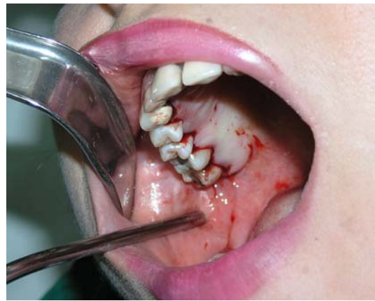
الف- برش سالکولار در پالاتال