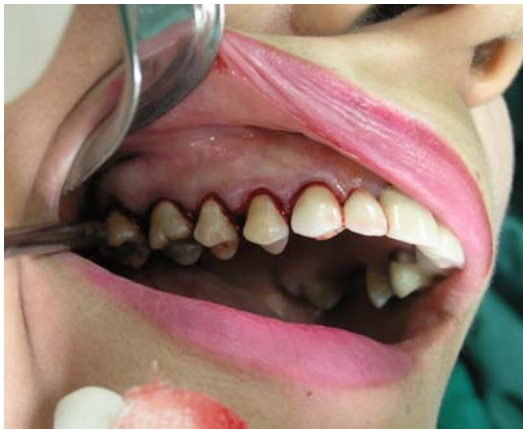
ب- برش سالکولار در بایکال