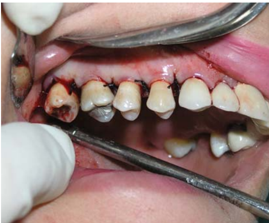
ی- برگرداندن فلپ‌ها و Suture کردن آنها