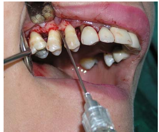
ه- تزریق Emdogain در داخل ضایعه استخوانی