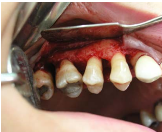
د- دبریدمان کامل ضایعه استخوانی