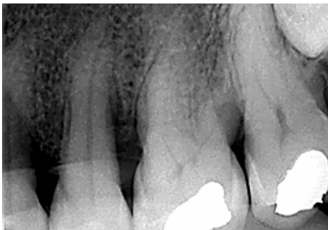
د- تصویر RVG سه ماه بعد از جراحی