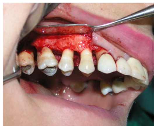
ج- بلند کردن فلپ موکوپریوستال