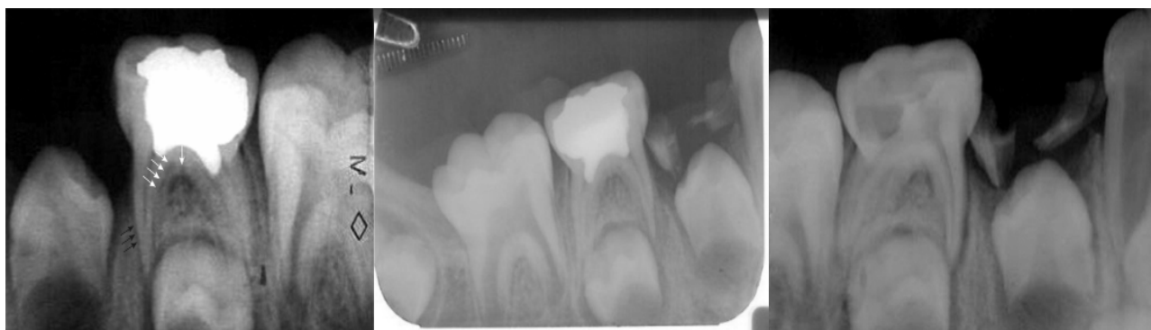
الف ب ج شکل ۱ الف- رادیوگرافی درمان به روش FC: شکست درمان- عکس اولیه ب- رادیوگرافی درمان به روش FC: شکست درمان پیگیری سه ماهه ج- رادیوگرافی درمان به روش FC: شکست درمان پیگیری شش ماهه. تحلیل در عاج (پیکان سفید) و نازک شدن ریشه مزیال (پیکان سیاه)