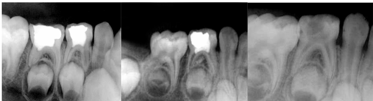
الف ب ج شکل ۳ الف- رادیوگرافی درمان به روش MTA: موفقیت درمان عکس اولیه ب- رادیوگرافی درمان به روش MTA: موفقیت درمان پیگیری سه ماهه ج- رادیوگرافی پالپوتومی موفقیت MTA پس از شش ماه