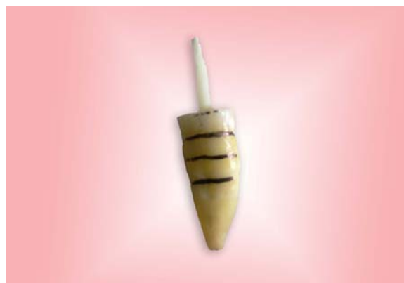
شکل ۱- ریشه علامت گذاری شده

قطر پست استفاده شده در این تحقیق ۱/۵ میلی‌متر و ضخامت نمونه‌ها ۲ میلی‌متر بود. برای آنالیز داده‌ها از برنامه‌های آماری ANOVA, one-sample Kolmogorov-Smirnov و T-test با P < 0.05 به عنوان سطح معنی‌داری استفاده شد. کلیه عملیات آماری با استفاده از نرم افزار SPSS، ویراست ۱۱/۵، تحت ویندوز XP انجام پذیرفت.