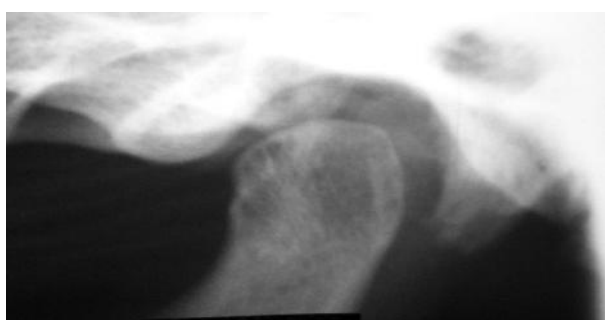
شکل ۱- تصویر ناحیه TMJ در رادیوگرافی پانورامیک با ضایعه (تصویر بالا) و بدون ضایعه (تصویر پایین)