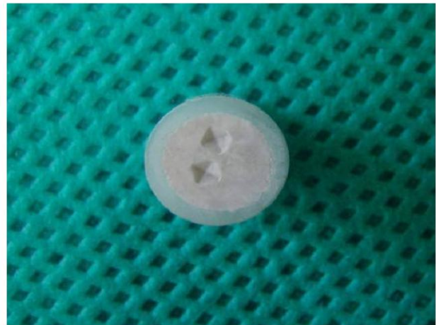
شکل ۴- اثر سنجه فرورونده (Indenter) بر سطح ماده

می‌کرد که موجب ایجاد یک فرورفتگی در سطح آن می‌شد (شکل ۴).