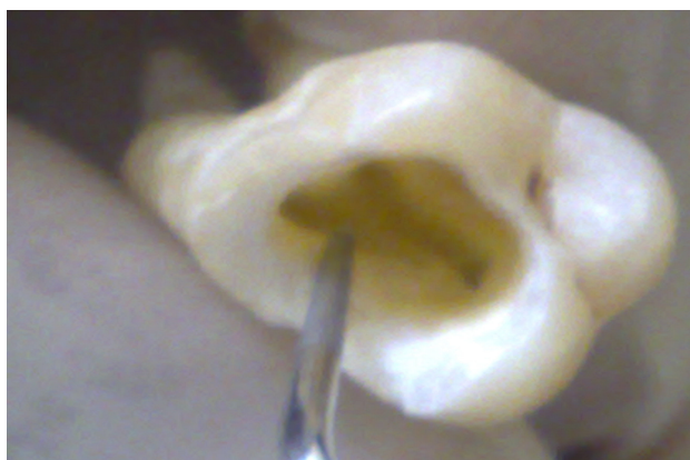
شکل ۱- عمل Troughing با تیپ اولتراسونیک

با توجه به اینکه یکی از موانع دستیابی به کانال MB 2 وجود برآمدگی‌های عاجی در حد فاصل کانال مزیوباکال و پالاتال در مولرهای ماگزایلا می‌باشد، جهت حذف این برآمدگی و کمک به کشف کانال MB 2 ابتدا به کمک دستگاه اولتراسونیک، (NSK، ژاپن) و با استفاده از سر قلم مخصوص این کار، عمل troughing با قدرت درجه ۵ و مدت زمان ۳-۵ ثانیه همراه با اسپری آب بر روی تمام نمونه‌ها انجام و برآمدگی عاجی مذکور برداشته شد (شکل ۱).