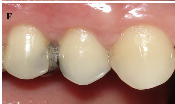
شکل ۳- مراحل جراحی نسج همبندی (SCTG)

A: نمای پیش از جراحی ضایعات تحلیل‌لته بر روی پره مولرهای راست ماگزینا، B: Incision اولیه، C: Split thickness flap، D: CTG برداشته شده از کام، E: قرارگیری CTG زیر Flap و بخیه، F: شش ماه پس از جراحی