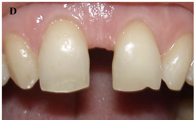
شکل ۲- SCPF

A: نمای پیش از جراحی ضایعات لثه بر روی لترال و کانین چپ B: ماگزایلا، C: Modified semilunar incision، C: فلپ کرونالی شده و D: شش ماه پس از جراحی بخیه،