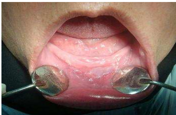
بیمار ۱- ۳ ماه پس از جراحی

در مطالعه Sezar و همکاران (۹) همه بیماران تحت جراحی وستیبولوپلاستی کلارک قرار گرفتند. ما نیز در این مطالعه این روش جراحی را بعلت انقباض کمتر اسکار انتخاب کردیم (۱۰). هیچ تفاوت آماری معنی‌داری در ناحیه وستیبولار افزایش یافته (ایجاد شده طی جراحی) و میزان Relapse بین آلوگرفت‌های Dura mater و Fascia lata و پیوندهای مخاطی پالاتالی در مطالعه Sezar مشاهده نشد و این درحالی بود که بازگشت ناحیه وستیبولار ایجاد شده با Fascia lata بیشتر از دو روش دیگر رخ داد.