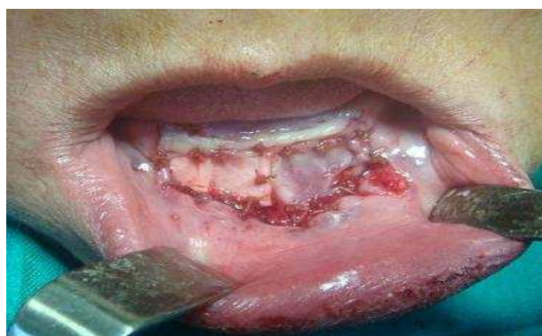
بیمار ۱- بلافاصله پس از جراحی

مزیت اولیه Alloderm نسبت به آلوگرفت‌های قبلی شامل عدم حضور هرگونه سلول که توانایی بالقوه انتقال ویروس‌ها را دارد و عدم حضور کمپلکس تطابق بافتی کلاس I و II مربوط به رد پیوند می‌باشد (۴). در مطالعه مشابه که توسط Sezar و همکاران (۹) جهت مقایسه پیوندهای مخاطی اتوزن با آلوگرفت‌های Collagen-based و Solvent-preserved در وستیبولوپلاستی انجام شد، شش بیمار در هر یک از گروه پیوندهای فوق قرارداد شدند. در تعیین حجم نمونه این مقاله از تفاضل میانگین عمق وستیبول و انحراف معیار قبل از جراحی و ۶ ماه بعد از آن در گروه Autogenous graft و Allograft استفاده گردید و بدین صورت تعداد نمونه‌ها به صورت ۱۰ بیمار زوجی برآورده شد. بدین صورت با حذف عوامل مخدوش‌کننده امکان مقایسه هر فرد با خودش فراهم گردید.