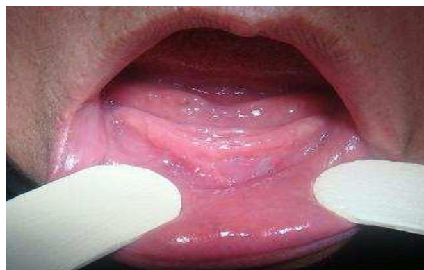
بیمار ۱- یکماه پس از جراحی

در مطالعه Sezar و همکاران (۹) همه بیماران تحت جراحی وستیبولوپلاستی کلارک قرار گرفتند. ما نیز در این مطالعه این روش جراحی را بعلت انقباض کمتر اسکار انتخاب کردیم (۱۰). هیچ تفاوت آماری معنی‌داری در ناحیه وستیبولار افزایش یافته (ایجاد شده طی جراحی) و میزان Relapse بین آلوگرفت‌های Dura mater و Fascia lata و پیوندهای مخاطی پالاتالی در مطالعه Sezar مشاهده نشد و این درحالی بود که بازگشت ناحیه وستیبولار ایجاد شده با Fascia lata بیشتر از دو روش دیگر رخ داد.