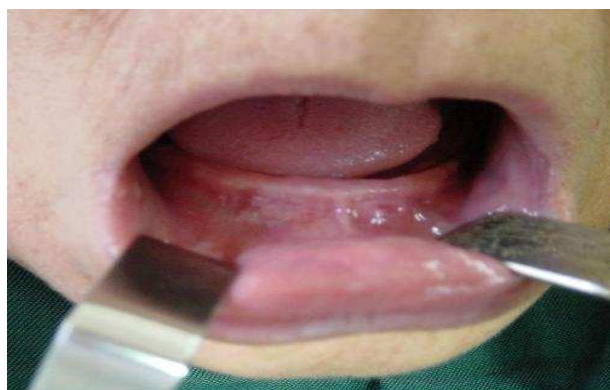
بیمار ۱- قبل از جراحی