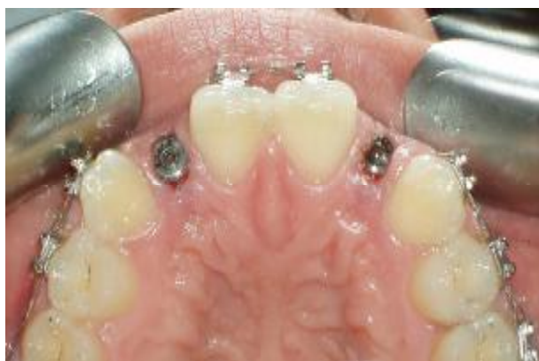
شکل ۴- مرحله دوم جراحی بیمار