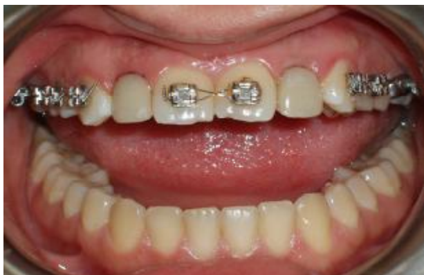
شکل ۱۰- رستوریشن‌های موقتی در زمان اتصال اولیه