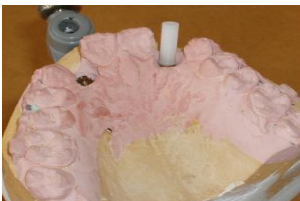
شکل ۸- اباتمنت پلاستیکی کست شونده