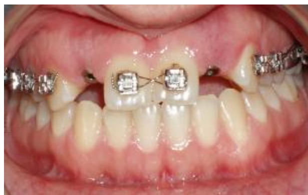
شکل ۵- وضعیت نسج نرم در زمان قالب گیری