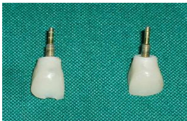
شکل ۹- رستوریشن‌های موقتی پیچ شونده

حاوی نگاره رستوریشن‌های موقتی، رستوریشن‌های PFM سمان شونده نهایی ساخته شدند.