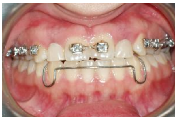
شکل ۱- بیمار در پایان درمان ارتودنسی

توصیه شد ظرف یک ماه اول بعد از جراحی از پلاک متحرک فک بالا استفاده نکند و بعد از سپری شدن این دوره با ایجاد ریلیف در موقعیت ایمپلنت‌ها فقط در موارد ضروری از پلاک استفاده شد. بعد از گذشت دوره التیام ۶ ماهه، جراحی مرحله دوم با سوراخ کردن نسج روی ایمپلنت‌ها انجام شد و Healing abutment های 3/5 \times 4/5 میلی‌متر از نوع Straight emergence profile به سفارش جراح و با توجه به فضای مزیدیستالی کم بین دندان‌های مجاور روی فیکسچرها بسته شدند (شکل ۴).