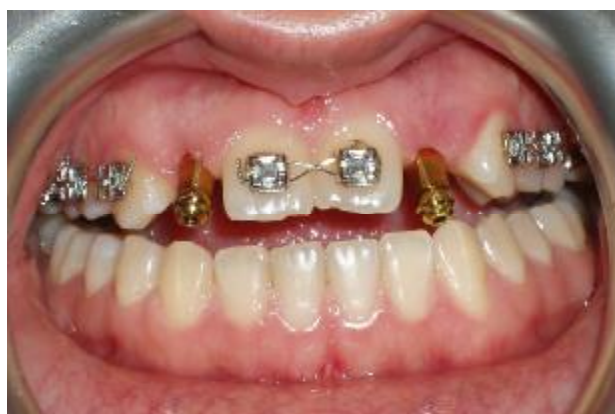
شکل ۶- کویپنگ های قالب گیری

جهت اطمینان از گیر کافی کامپوزیت به اباتمنت های پلاستیکی، در سطح اباتمنت ها به وسیله فرز خشونت ایجاد شد. سپس در لابراتوار کامپوزیت لایت کیور (Spectrum, Dentsply, Germany) با رنگ