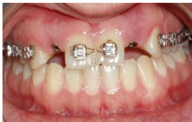
شکل ۵- وضعیت نسج نرم در زمان قالب گیری