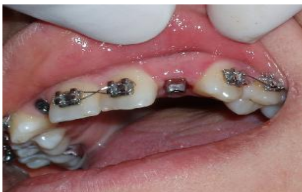
شکل ۷- اباتمنت تراش خورده متصل به ایمپلنت

از این رو دو عدد Healing abutment از نوع Flared emergence profile، ۳/۵×۴/۵ میلی متر جایگزین Healing abutment های قبلی شدند.