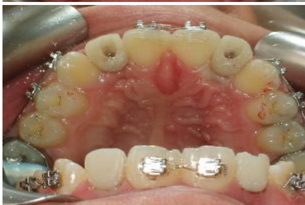
شکل ۱۰- رستوریشن‌های موقتی در زمان اتصال اولیه