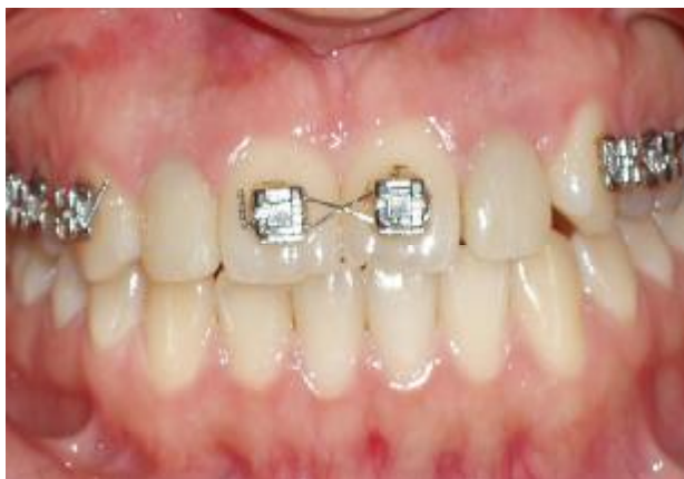
شکل ۱۱- وضعیت نسج نرم پس از سپری شدن ۲ هفته

بعد از گذشت یک هفته از بستن Healing اباتمنت‌های Flared، بیمار فرا خوانده شد و اباتمنت‌ها باز شدند. لثه تا حدودی Recontour شده بود. رستوریشن‌های کامپوزیتی در دهان تنظیم شدند، کانتور مناسب در ناحیه لثه ایجاد شد و بعد از ارزیابی تماس‌های پروگزیمال و اکلوزال، سطح کامپوزیتی رستوریشن‌های موقتی پالیش و رستوریشن‌ها با ۳۰ N torque پیچ شدند و سوراخ پیچ که در ایمپلنت سمت راست در لبه انسیزال و در سمت چپ پالاتالی بود با همان کامپوزیت لایت کیور سیل شد (شکل ۱۰). پس از گذشت دو هفته با توجه به ایجاد کانتور مناسب لثه و پاپی‌های بین‌دندانی (شکل ۱۱)، ابتدا یک قالب آلژیناتی از فک بالا با حضور رستوریشن‌های موقتی تهیه و سپس قالب‌گیری غیرمستقیم مجدد از فیکسچرها و کانتور جدید لثه با استفاده از رستوریشن‌های موقتی در نقش کوپینگ‌های قالب‌گیری انجام شد، کست نهایی بلافاصله ریخته شد و رستوریشن‌ها به دهان بیمار منتقل گردید. در لابراتوار با کمک ایندکس سیلیکونی ساخته شده روی کست