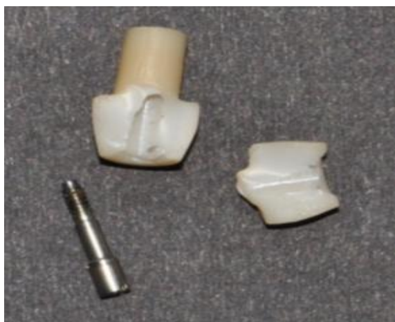
شکل ۳- شکست ناحیه اتصال در گروه Copy-milled