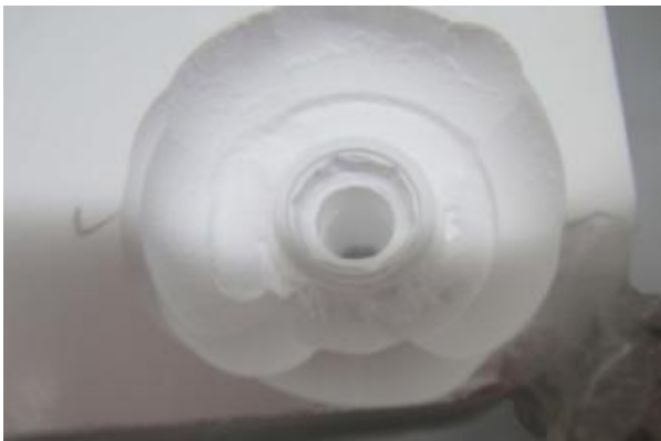
شکل ۱- ساخت نمونه‌های Copy-milled با استفاده از بلوک‌های زیر کونیایی

به ترتیب استفاده عبارت بودند از: 0.3C, 1XL, 2U, 0.48A, 1.6A, 0.6A, 2A, 4L. پس از اینکه نمونه الگو روی صفحه اسکن دستگاه با چسب ثابت شدند، بلوک زیر کونیای شماره ۱۶ در سمت دیگر قرار گرفت و تراش اباتمنت‌ها در داخل بلوک توسط فرزهای تراش انجام شد (شکل ۱). سپس اباتمنت‌های تراش خورده برای اینکه رنگ موردنظر را پیدا کنند، در محلول Color covering گذاشته شدند. سپس زیر نور Red Lamp خشک شده و جهت Sintering در کوره با درجه حرارت ۱۵۰۰ درجه سانتی‌گراد به مدت ۸ ساعت قرار گرفتند (۲۱).