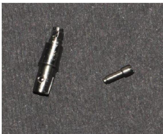
شکل ۴- شکست پیچ اباتمنت در گروه تیتانیومی پیش ساخته