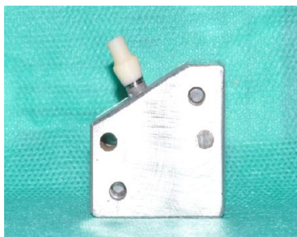
شکل ۲- مانت نمونه‌ها در جیگ اختصاصی با زاویه ۳۰ درجه