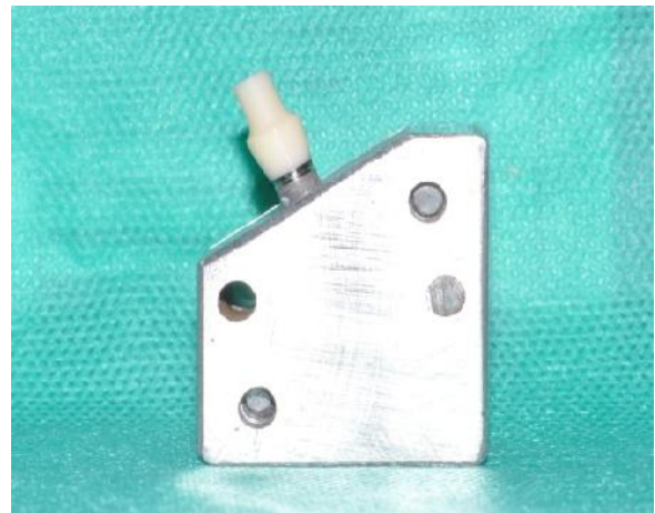
شکل ۲- مانت نمونه‌ها در جیگ اختصاصی با زاویه ۳۰ درجه