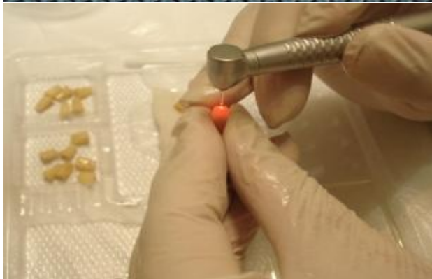
شکل ۱- تیپ‌های G6 لیزر Er, Cr:YSGG و آماده‌سازی حفرات انتهای ریشه توسط این لیزر

عاجی حفرات رتروگرید گردد و بدین ترتیب به گیر بهتر و همچنین ایجاد سیل مناسب تر کمک نماید (۱۷). طبق مطالعات صورت گرفته بر روی CEM cement، این ماده از قدرت سیلان (Flow) بیشتری نسبت به MTA برخوردار است (۱۸)، بنابراین ممکن است بیشتر بتواند به بی‌نظمی‌های ایجاد شده در سطوح عاجی دیواره حفره انتهای ریشه و همچنین توبول‌های عاجی باز نفوذ نماید.