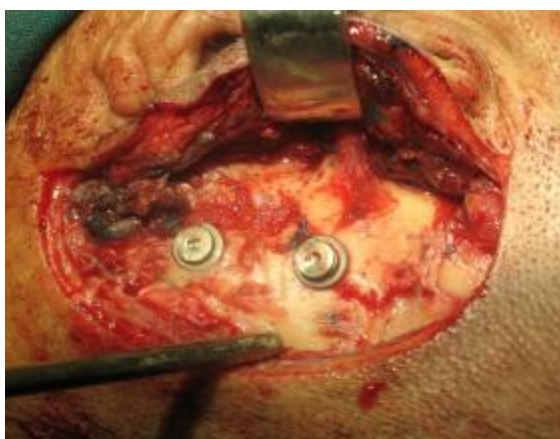
شکل ۱۰- قرار دادن ایمپلنت‌ها