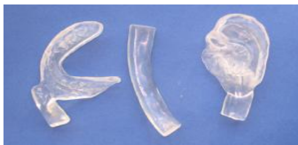
شکل ۲ - گوش آکریلی سمت چپ، بار آکریلی و رکورد اکلوزالی آکریلی