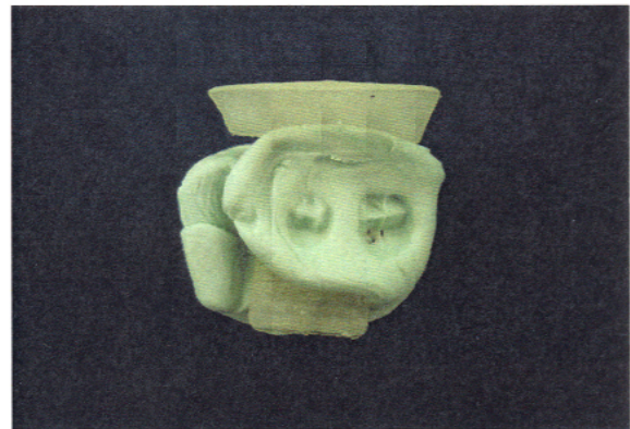
شکل ۱- تهیه رادیوگرافی RVG الف) Template تهیه شده از ماده قالب‌گیری