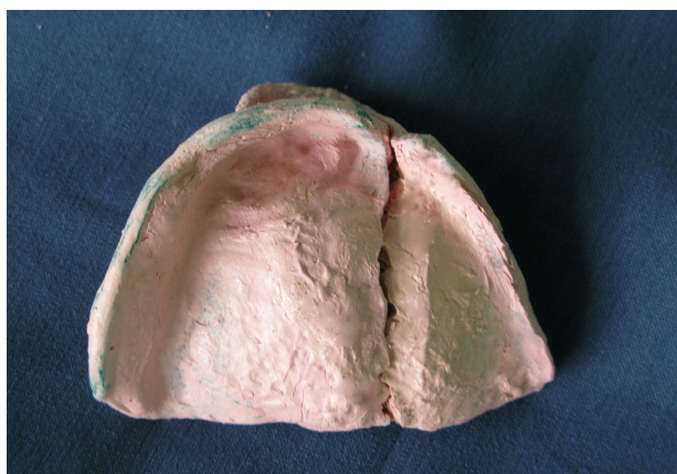
شکل ۲- کست با گچ دندانپزشکی

۷- بوردرها تنظیم شده و قالب به وسیله خمیر زینک اکساید ازنول (Kerr Italia, Ealerno, Italy) وقتی که دو قسمت در دهان به هم متصل شده بودند گرفته شد. زمانی که ماده Set شد، قالب به صورت ۲ قسمت جدا از هم از دهان خارج شده و اضافات از لبه‌های تری به وسیله تیغ بیستوری برداشته شد، سپس دو قسمت به هم متصل گشت و کست با گچ دندانپزشکی ریخته شد (شکل ۲).