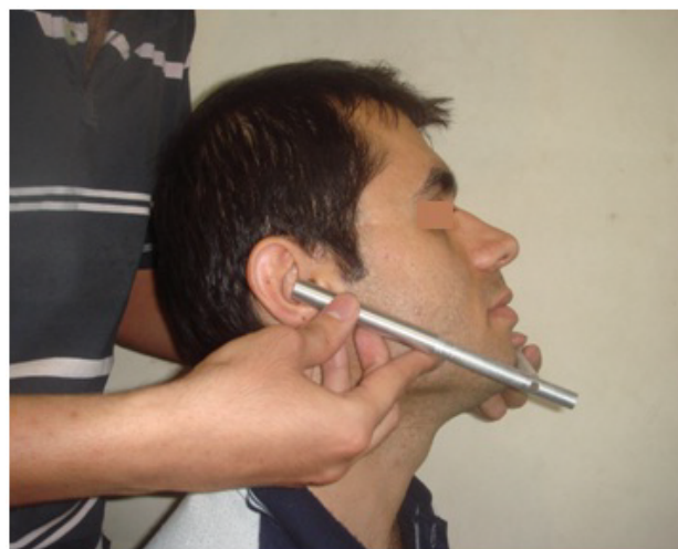
شکل ۴- اندازه‌گیری آنتروپومتریکی طول مؤثر مندیبل