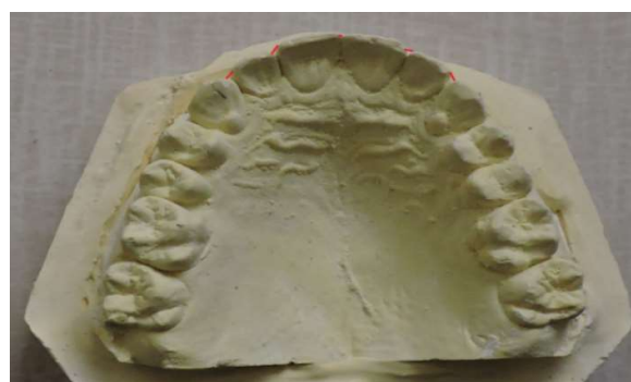
تصویر ۲- محل‌های مورد نظر برای محاسبه شاخص بی نظمی

به منظور ارزیابی پایایی و توافق درون‌مشاهده‌گر، دو هفته پس از پایان دوره پیگیری ۹ ماهه (T3) از ۱۵ بیمار به صورت تصادفی مجدداً قالب گیری انجام شد. کست‌های تهیه شده بار دیگر توسط پژوهشگر اصلی مورد اندازه گیری قرار گرفت و تمامی متغیرهای مورد مطالعه شامل اورجت، اوربایت، طول قوس، عرض بین کانی، عرض بین مولری و شاخص بی نظمی مجدداً ثبت شدند. به منظور تعیین میزان خطای اندازه گیری و بررسی توافق مشاهده‌گر، ضریب همبستگی درون‌طبقه‌ای (Intraclass Correlation Coefficient; ICC) محاسبه شد که مقدار آن بیش از ۰/۹۶۰ به دست آمد و بیانگر پایایی بسیار مطلوب اندازه گیری‌ها بود.